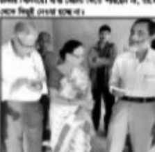
স্বাস্থ্য, শিক্ষা ও পরিবার কল্যাণ বিভাগের সচিব