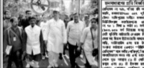
স্বাস্থ্য, শিক্ষা ও পরিবার কল্যাণ বিভাগের সচিব

স্বাস্থ্য, শিক্ষা ও পরিবার কল্যাণ বিভাগের সচিব।