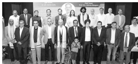
मुंबई : आयआयटी मुंबईच्या ६७व्या स्थापना दिनानिमित्त ११ माजी विद्यार्थ्यांना 'डिस्टिंक्शंड अल्युम्नस अवॉर्ड'ने सन्मानित करण्यात आले.