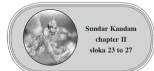
Sundar Kandan chapter II sloka 23 to 27