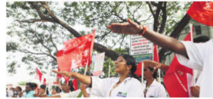
Workers of the 108 ambulance service staged a protest, on Monday