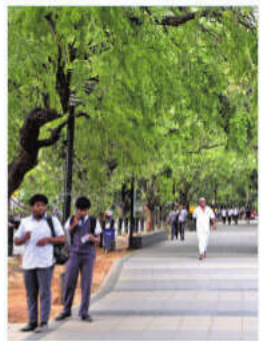
Race course road | S SENBAGAPANDIYAN