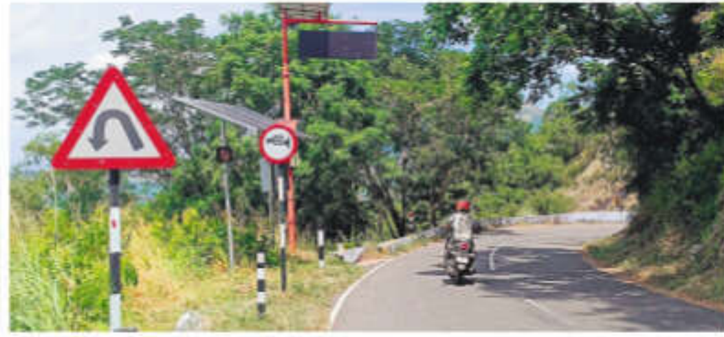
Over 40 people have sustained serious injuries in about 15 separate accidents on the Valparai Ghat Road in recent months | EXPRESS

Police point out that thrill-seeking riders on high-powered two-wheelers often record themselves speeding along the curves to post on social media for "likes & shares," putting themselves and others at risk. Similarly, drivers of tourist vehicles, accustomed to driving on flat terrain, frequently underestimate the challenges of the winding mountain road, leading to rollovers and