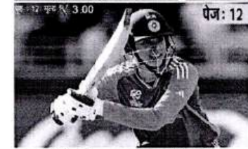
भारत ने पाकिस्तान को छह विकेट से ...