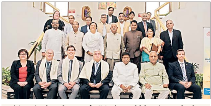
सस्केचेवान और हरियाणा विधानसभा की कॉन्फ्रेंस के बाद प्रतिनिधिमंडलों का सामूहिक चित्र।