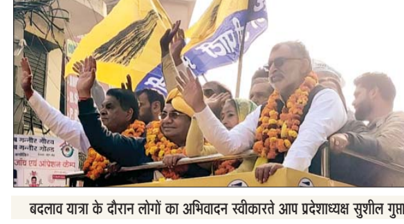
बदलाव यात्रा के दौरान लोगों का अभिवादन स्वीकारते आप प्रदेशाध्यक्ष सुशील गुप्ता।