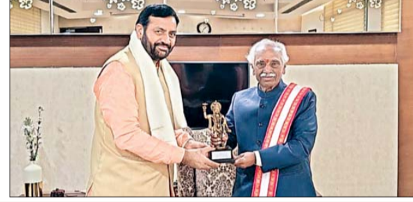
नायब सैनी (दाएं) गुरुग्राम में हरियाणा के राज्यपाल बंडारु दत्तात्रेय से शिष्टाचार भेंट करते

मुलाकात करने पहुंचे। प्रदेश अध्यक्ष ने कहा कि तीन राज्यों में प्रचंड जीत के बाद अब लोकसभा चुनाव की तैयारी में बीजेपी जुट गई है। चुनाव 2024 में लोकसभा में दस की दस सीटों पर कमल खिलाने और विधानसभा चुनाव में प्रचंड जीत पर भाजपा काम कर रही है। उन्होंने कहा कि प्रदेश प्रभारी बिप्लव कुमार देब से मुलाकात कर उनको पार्टी गतिविधियों की