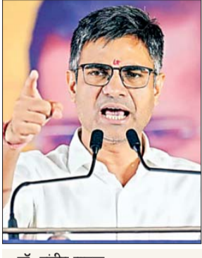
डॉ. संदीप पाठक

इसके बाद अब कोई उम्मीद नजर नहीं आने पर ओलंपियन मेडलिस्ट साक्षी मलिक ने कुश्ती से ही संन्यास की घोषणा करनी पड़ी। उन्होंने कहा कि इसके लिए बीजेपी को बेनकाब करने की जरूरत है। जनता सबकुछ देख रही है। 'आप' संगठन महामंत्री और राज्यसभा सांसद डॉक्टर संदीप पाठक ने कहा कि पूरी दुनिया में भारत को प्रजातंत्र के लिए जाना जाता है। कहा जाता है कि भारत का प्रजातंत्र सबसे पुराना, निष्पक्ष और मजबूत है। प्रजातंत्र का मूल आधार ही प्रश्न पूछना होता है। अगर एक चुने हुए सांसद को सदन में खड़े होकर सवाल पूछने की ही आजादी नहीं है तो फिर उसका सांसद होने का फायदा ही क्या है? आप सोच कर