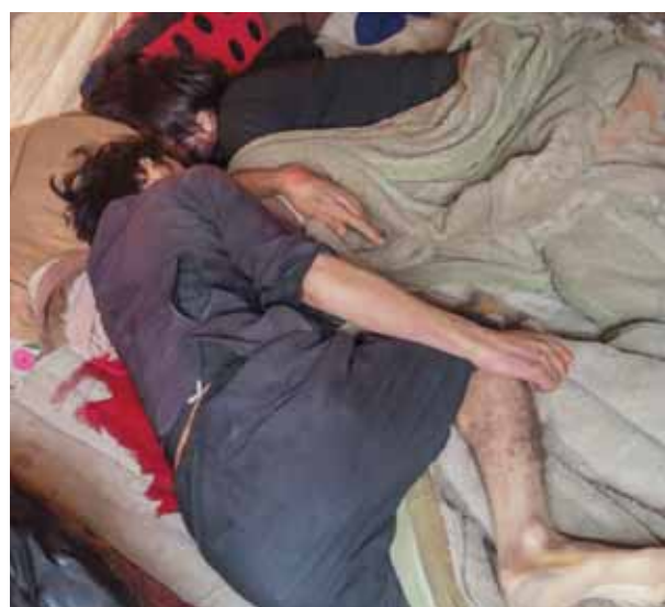
Bodies of labourers killed in Pakistan's Khyber Pakhtunkhwa province