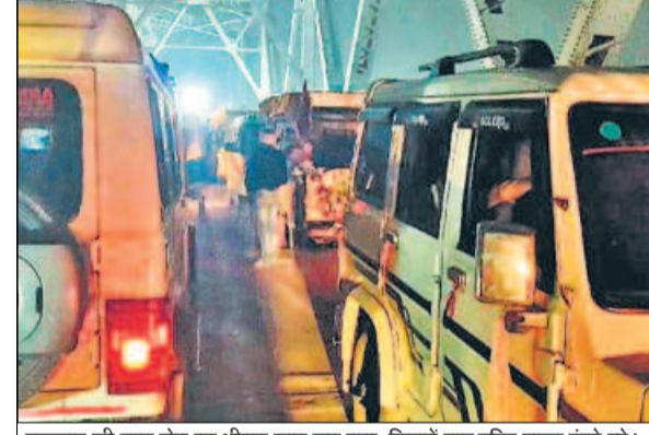
शुक्रवार की शाम सेतु पर भीषण जाम लग गया, जिसमें चार पहिए वाहन फंसे रहे।

शुक्रवार की शाम सेतु पर भीषण जाम लग गया, जिसमें चार पहिए वाहन फंसे रहे। जाम में चार पहिए वाहन फंसे रहे। मोटरसाइकिल सवार भी घंटों जाम से जुझते रहे। सेतु का फुटपाथ भी पूरी तरह पक हो गया। लोगों का पैदल चलना भी मुश्किल हो गया। शादी की वजह से सेतु पर ट्रैफिक का दबाव बढ़ गया है। देर रात जाम की स्थिति और गहरा गई। सेतु के दोनों ओर पांच किलोमीटर तक लंबा जाम लग गया। खास कर नेशनल हाइवे-31 से आवागमन करने वाले वाहनों को बेतरतीब ढंग से वाहन ओवरटेक करते हैं, जिससे सेतु पर आवाजाही ठप हो जाती है। जाम की मुसीबत झेलने वाले यात्रियों ने स्थानीय पुलिस के प्रति नाराजगी जताई।