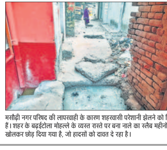
मसौढ़ी नगर परिषद की लापरवाही के कारण शहस्वामी परेशानी झेलने को विद्यार्थी हैं। शहर के बड़ईटोला मोहल्ले के व्यस्त रास्ते पर बना नाले का स्लैब महीनों से खिलकर छोड़ दिया गया है, जो हादसों को दावत दे रहा है।

फुलवारीशरीफ। नाबालिक बच्चे के साथ शारीरिक संबंध बना वीडियो वायरल करने वाले आरोपित को फुलवारीशरीफ पुलिस ने गिरफ्तार कर लिया। पूछताछ के बाद उसे जेल भेज दिया गया।