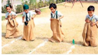
प्रतियोगिता में हिस्सा लेते स्टूडेंट्स।

सवेरा न्यूज/कथुरिया, अबोहर : सिमिगो इंटरनेशनल स्कूल में नर्सरी कक्षा के विद्यार्थियों के लिए कोलेक्ट द बॉल इन सैक गतिविधि का आयोजन किया गया। जिसमें बच्चों को आसपास बिखरी बॉल्स को उठा कर अपनी बोरी (सैक) में रखना था। बच्चों ने इस गतिविधि के दौरान टीम के रूप में काम करते हुए अपनी एकजुटता का संदेश भी दिया। भारतीय ने बताया कि ऐसी गतिविधियां लगातार आयोजित की जा रही हैं और हरेक कक्षा के लिये अलग-अलग टाइम टेबल बनाकर उन्हें खेल के मैदान में अभ्यास का मौका दिया जाता है ताकि बच्चे सिर्फ किताबों में ही उलझे न रहें, बल्कि वे अपनी कला, खेल का बेहतरीन प्रदर्शन कर सकें।