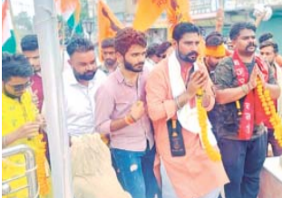
शहीद भगत सिंह की प्रतिमा को नमन करते पदाधिकारी।