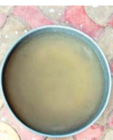
जलदाय विभाग की पेयजल सफाई से आ रहा दूषित जल।