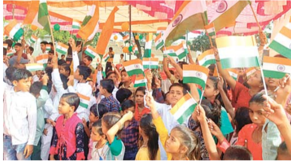
गांव कुलार में स्वतंत्रता दिवस मनाते बच्चे।