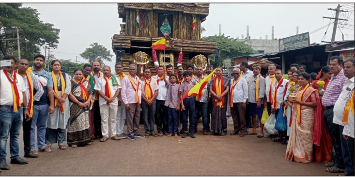
ಮಾಡುತ್ತಿದ್ದು ನಾವೆಲ್ಲರೂ ತಾಯಿ ನಾಡು ಮತ್ತು ಕನ್ನಡ ಭಾಷೆಯ ಬಗ್ಗೆ ಅಭಿಮಾನ ಬೆಳೆಸಿಕೊಂಡು ಸಂಕಲ್ಪನೆಗೆ ಬದ್ಧರಾಗಿರಬೇಕು ಎಂದು ತಿಳಿಸಿದರು.