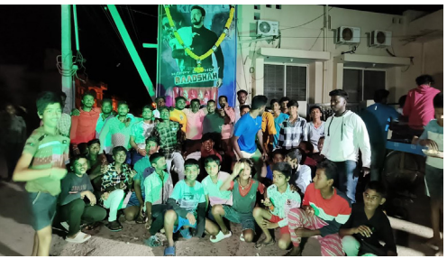
ತಿ.ನರಸೀಪುರ ಪಟ್ಟಣದ ಶ್ರೀರಾಘವೇಂದ್ರ ಬೀದಿಯಲ್ಲಿ ಕಿಚ್ಚಿ ಸುದೀಪ್ ಅವರ 51ನೇ ವರ್ಷದ ಹುಟ್ಟುಹಬ್ಬವನ್ನು ಆಚರಿಸಲಾಯಿತು.