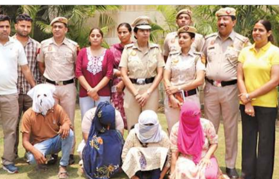
नवजात तस्करी में मध्य जिला पुलिस द्वारा गिरफ्तार किए गए आरोपित