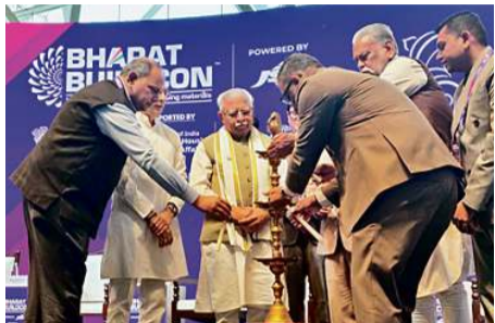
केंद्रीय मंत्री मनोहर लाल की उपस्थिति में दीप प्रज्वलन से हुई 'भारत बिल्डकान 2026' की शुरुआत

जासं, पश्चिमी दिल्ली : केंद्रीय आवास एवं शहरी कार्य मंत्री मनोहर लाल ने देश में तेजी से पैर पसारते शहरीकरण की जरूरतों को पूरा करने के लिए निर्माण कार्यों की गति को बढ़ाने का आह्वान किया है। ब्राउका स्थित यशोभूमि में आयोजित 'भारत बिल्डकान 2026' के उद्घाटन सत्र को संबोधित करते हुए उन्होंने गुणवत्ता, टिकाऊपन (ड्यूरैबिलिटी) और किफायती आवास को भविष्य की मुख्य प्राथमिकता बताया। इस अवसर पर वाणिज्य एवं उद्योग राज्य मंत्री जितिन प्रसाद भी मौजूद रहे।