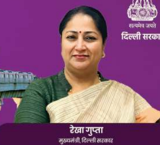
रेखा गुप्ता सुपरानि, दिल्ली सरकार