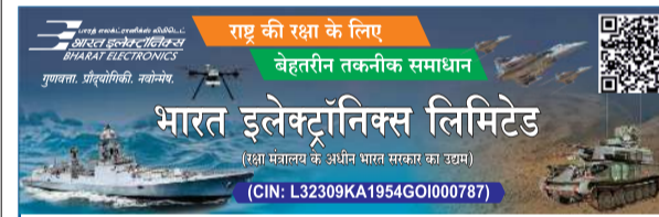
आवेदन की अंतिम तिथि और विज्ञापन की पूरी जानकारी के लिए, कृपया हमारी वेबसाइट www.bel-india.in में 'केरियर' भाग को देखें।