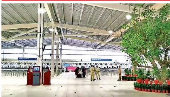
नई दिल्ली रेलवे स्टेशन पर अजमेरी गेट की ओर बना यात्री सुविधा केंद्र • आरकईव

स्टेशनों पर भी उपलब्ध कराने का निर्णय लिया गया है। रेलवे बोर्ड ने राजधानी के बड़े स्टेशनों के साथ ही 72 प्रमुख रेलवे स्टेशनों पर होलिंग एरिया बनाने की घोषणा की थी। आनंद विहार टर्मिनल पर इसके निर्माण की प्रक्रिया शुरू हो गई है। हजरत निजामुद्दीन रेलवे स्टेशन के लिए भी रेलवे बोर्ड की स्वीकृति मिल गई है। होलिंग एरिया के आकार और उसमें उपलब्ध होने वाली सुविधाओं के साथ भीड़ प्रबंधन के अन्य पहलुओं की रिपोर्ट तैयार करने की जिम्मेदारी राइट्स को दी गई है। उसकी सर्वे रिपोर्ट के आधार पर आगे कदम उठाए जाएंगे। राइट्स के अध्ययन में स्टेशन पर पहुंचने वाली ट्रेनों व यात्रियों की संख्या, भीड़ बढ़ने का समय के साथ ही किसी विशेष प्लेटफार्म और विशेष दिशा की ट्रेनों अधिक भीड़ होने और इसके कारण को शामिल किया जाएगा।