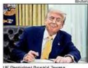
US President Donald Trump

New York/Washington: US President Donald Trump said he has a "very good relationship" with India, but the "only problem" he has with the country is that it is one of the highest tariffing nations in the world.