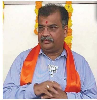
Eknath Shinde-led Maha Yuti government.

Chavan, a grass-roots worker, had been a minister in the Fadnavis-headed BJP-Shiv Sena government from 2014-19 and the previous