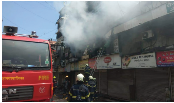
closed shops at the Heera Panna Shopping Centre, the official said.

It was a "level-one" blaze and confined to two