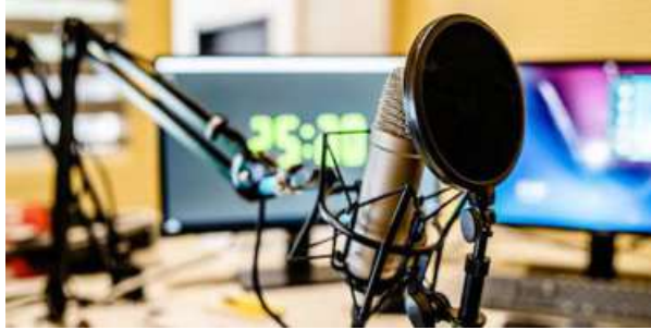
COST FACTOR. Industry will prefer free technology over the efficient but costly option, feels expert

DRM is the more compelling choice considering the system already caters to around 900 million Indian users, over 6 million cars and a pre-existing ecosystem with DRM chipsets and module designs is available. Also, DRM is more spectrum efficient as compared with HD Radio.