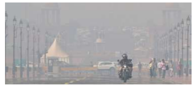
BREATHLESS IN DELHI. Smog blankets Kartavya Path in New Delhi on Thursday. SHASHI SHEKHAR KASHYAP

The CAQM had attracted the Supreme Court's ire for