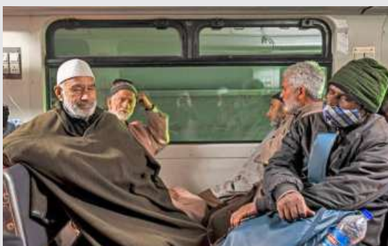
RAIL STORY. Passengers inside a train on the Banihal-Katra section of the USBRL project.

The USBRL project consists of 38 tunnels, including Tunnel-T, the longest in the country at 12.75 km