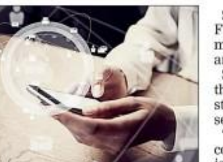
Some of the areas where 5G FWA will be suitable include remote locations, remote villages and schools.

According to Peter Jarich, head of GSMA Intelligence, telecom operators worldwide have not been able to monetise 5G networks despite billions of dollars in investments. "The promise of 5G was that it was going to unlock new revenues and new capabilities that