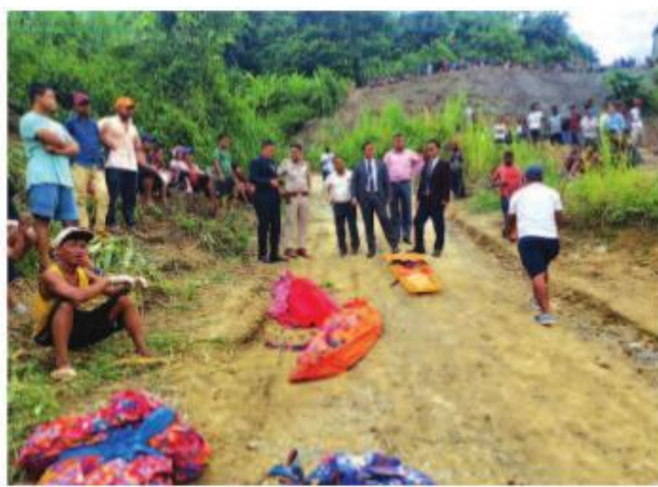
injured after the railway bridge collapsed near the mountainous Sairang area, about 21 km from Aizawl.

Various disaster response personnel continued their search operation for the second day on Thursday to recover more bodies in Mizoram's Sairang area, where an under-construction railway bridge collapsed on Wednesday killing at least 23 people and injuring three, officials said. Aizawl District administration and Police officials on Thursday said that 23 workers were killed and 22 bodies recovered so far while two more workers and an engineer were injured and now under medical treatment in Aizawl hospital. Officials of Mizoram Relief and Disaster Management Department on Wednesday said that at least 26 workers were killed and two others