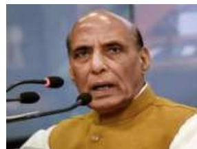
Defence Minister Rajnath Singh

duced from defence public sector undertaking Bharat Electronics Ltd (BEL), the Ministry stated.