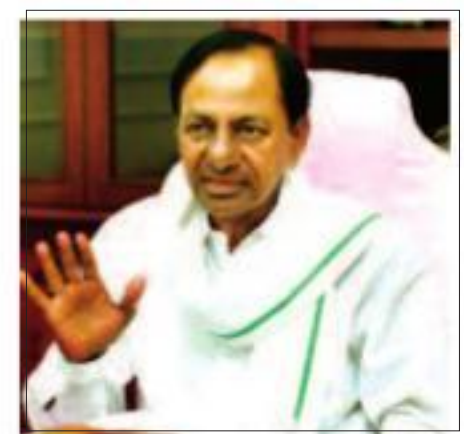
STATESMAN NEWS SERVICE HYDERABAD, 24 AUGUST

In political trade-off, KCR inducts new minister in Cabinet