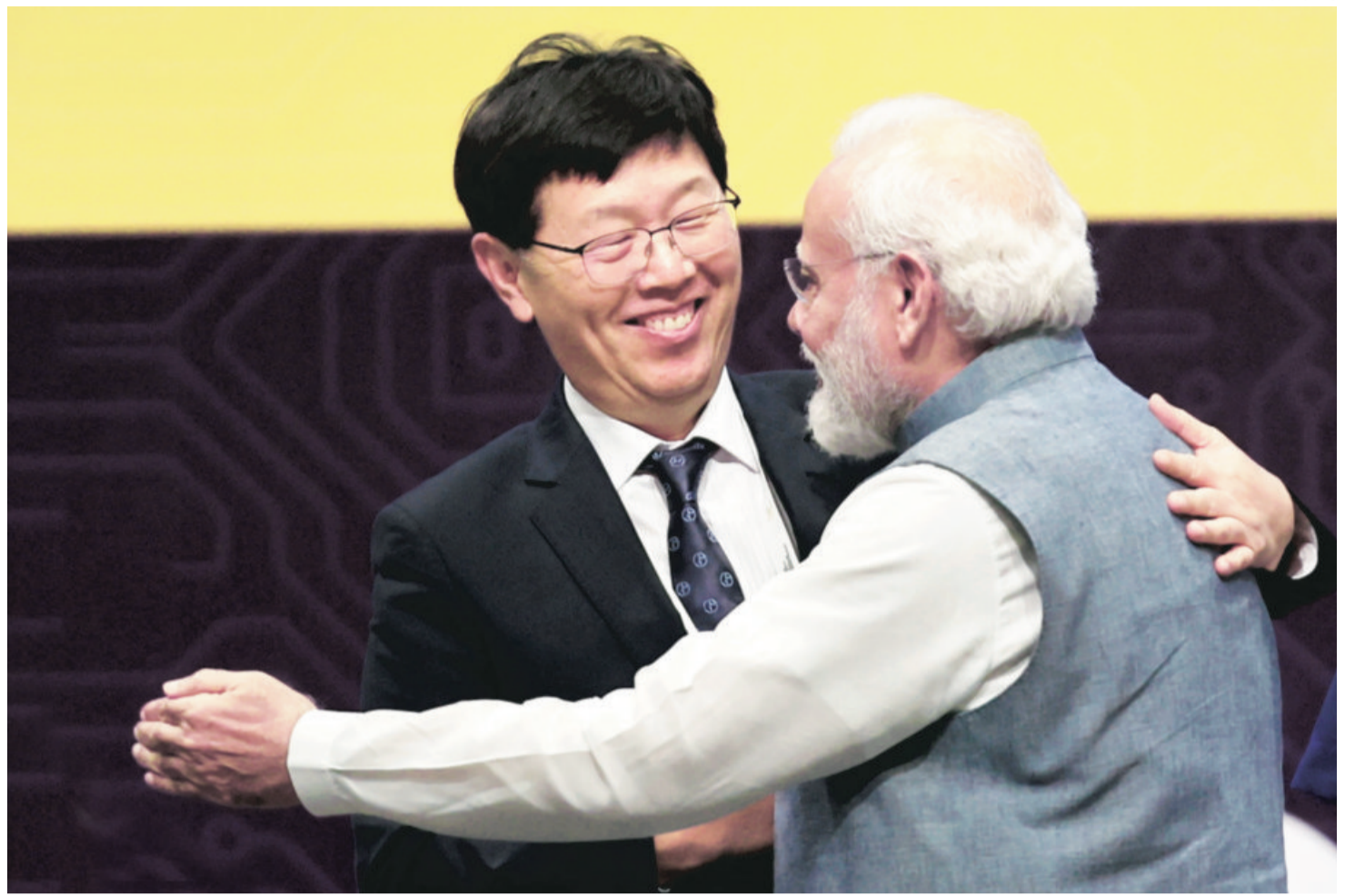
A GESTURE OF COOPERATION: "Taiwan is and will be your most trusted and reliable partner," Foxconn Chairman Young Liu (left) promised Prime Minister Narendra Modi at Semicon India in Gandhinagar recently

August 2023: Discussions are on with Gujarat to set up a semiconductor plant on its own after withdrawing from a partnership with Vedanta