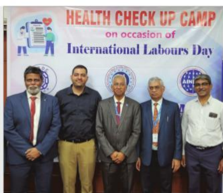
HEALTH CHECK UP CAMP on occasion of International Labour's Day