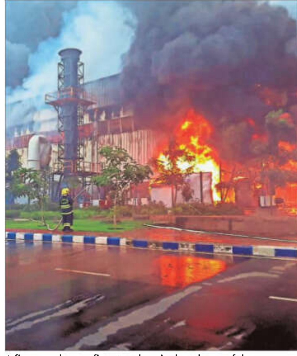
A fireman douses fire at a chemical godown of the electronics component factory of Tata Electronics, in Hosur (Tamil Nadu) on Saturday

Police sources said about 11 workers who were near the accident site suffered suffocation and were admitted to the Government General Hospital. "All the 11 persons were treated as out-patients and nine of them have been discharged. The remaining two are under treatment and will be discharged later," they said.