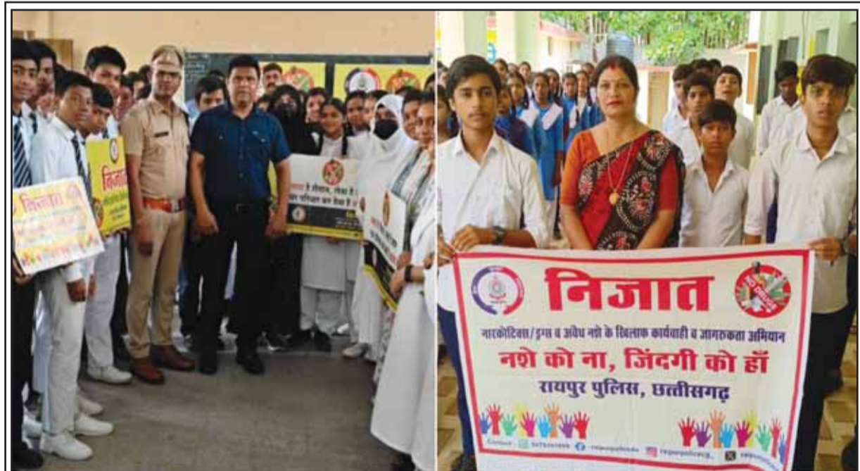
Under the Nijat Campaign, the Chhattisgarh Police educated youths about the dangers of drug addiction. The campaign took place at educational institutions in Raipur district on Sunday.