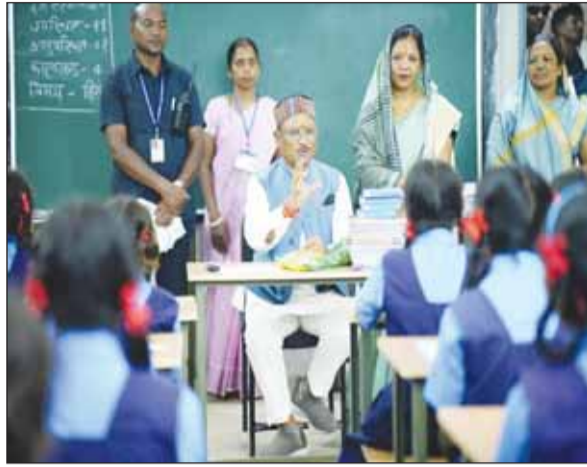
process of children. The academic session for 2024-25 started on June 26 in Chhattisgarh. School Education Secretary Siddharth Komal

introduction of Sadi language for primary education in Jashpur district. The initiative is a part of the broader vision under NEP 2020 to make education more inclusive and accessible to children in their native languages. Its objective is to increase the access and quality of education in tribal communities so that children can get education in their mother tongue and stay connected with their culture. The Chief Minister emphasized the importance of primary education in local languages and said that this will improve the understanding and learning