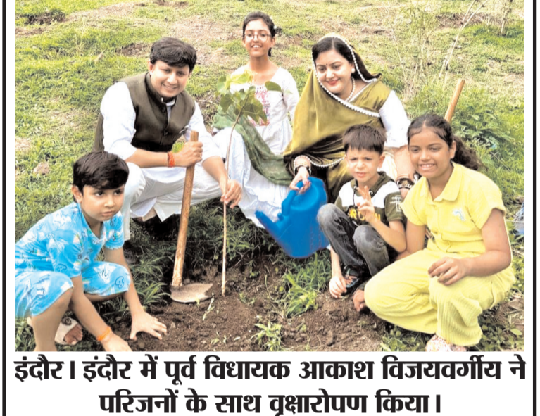
इंदौर। इंदौर में पूर्व विधायक आकाश विजयवर्गीय ने परिजनों के साथ वृक्षारोपण किया।