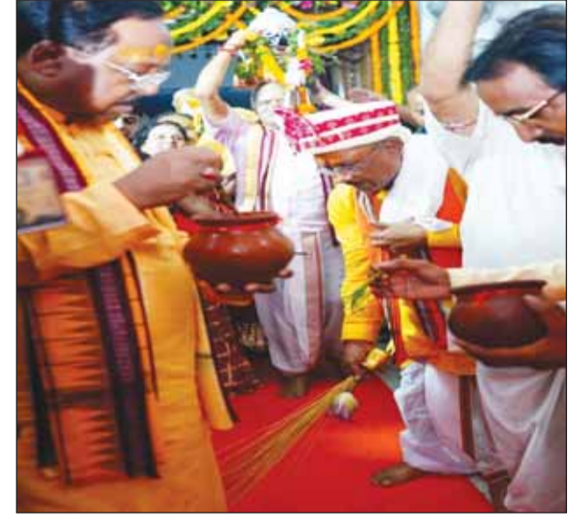
holds a place of profound reverence among the people of Chhattisgarh, akin to their counterparts in Odisha.

The Lord Jagannath Rath Yatra was celebrated with zeal and fervour in the Chhattisgarh capital on Sunday. Devotees pulled the chariots of Lord Jagannath, his brother Balbhadra and their sister Subhadra at a temple in Raipur's Gayatri Nagar area. Chief Minister Vishnu Deo Sai joined the Yatra. The event commenced with the ceremonial "Cheraphahara" ritual where the idol was brought to the chariot and the path was swept with a golden broom by the chief minister. Following this, Sai carried the idol of Lord Jagannath to the chariot. Sai said Lord Jagannath