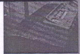
CM Manohar Lal Khattar after inauguration of Driving Training and Research Institute.

Meanwhile, the IDTR has been set up by the government in collaboration with Honda Motorcycle and Scooter India Private Limited on 9.25 acres at a cost of Rs 34 crore under the corporate social responsibility