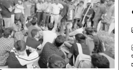
ఎన్ఆర్ఎం యూనివర్సిటీ అడ్డినిస్తే ఖైక్ వద్ద ఆందోళన చేస్తున్న విద్యార్థులు

• విద్యార్థుల ఆందోళన ప్రజాశక్తి - మంగళగిరి రూరల్ (గుంటూరు జిల్లా) మెన్, హాస్టల్ ఫీజుల పెంపు నిరసనల్లో రాజధాని ప్రాంతమైన సీరుకొండలోని ఎన్ఆర్ఎం యూనివర్సిటీ విద్యార్థులు గురువారం ఆందోళనకు దిగారు. మెన్, హాస్టల్ ఫీజులు రూ.12 వేలు పెంచడంతో ఆగ్రహం వ్యక్తం చేశారు. సుమారు 300 మంది వరకు విద్యార్థులు పల్లెలో అడ్డినిస్తే ఖైక్ వద్దకు చేరుకుని అక్కడే బైకాయించారు. పల్లెలో యాజమాన్యానికి వ్యతిరేకంగా నిరాచారు చేశారు. తమకు కొత్తగా సౌకర్యాల్లోకి తీసుకువచ్చిన ఇంజనీరింగ్ ఫీజు ఎందుకు పెంచారని ప్రశ్నించారు. ఇప్పటికే అధికంగా ఫీజులు తీసుకుంటున్నా సరైన సదుపాయాలు కల్పించడం లేదని అన్నారు. ఇదే పర్సంటేజీ రెండు రోజుల కిందట