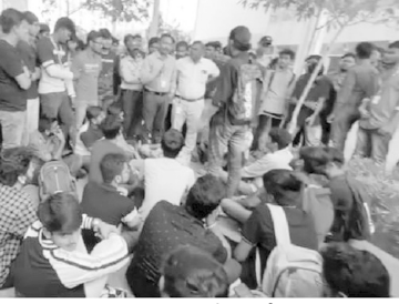
ఎన్ఆర్ఎం యూనివర్సిటీ అడ్డినిస్తే షాక్ వద్ద ఆందోళన చేస్తున్న విద్యార్థులు

• విద్యార్థుల ఆందోళన ప్రజాశక్తి - మంగళగిరి రూరల్ (గుంటూరు జిల్లా) మెన్, హాస్టల్ ఫీజుల పెంపు నిరసనల్ని రాజధాని ప్రాంతమైన సిరుకొండలోని ఎన్ఆర్ఎం యూనివర్సిటీ విద్యార్థులు గురువారం ఆందోళనకు దిగారు. మెన్, హాస్టల్ ఫీజులు రూ.10 వేలు పెంచడంతో ఆగ్రహం వ్యక్తం చేశారు. సుమారు 300 మంది వరకు విద్యార్థులు పల్లెట్ అడ్డినిస్తే షాక్ వద్దకు చేరుకుని అక్కడే బైకాయించారు. పల్లెట్ యాజమాన్యానికి వ్యతిరేకంగా నిరాచాలు చేశారు. తమకు కొత్తగా సౌకర్యాల్లేమీ కల్పించకపోతే ఇంక ఫీజు ఎండుకు పెంచారని ప్రశ్నించారు. ఇప్పటికే అధికంగా ఫీజులు తీసుకుంటున్నా సరైన సదుపాయాలు కల్పించడం లేదని అన్నారు. ఇదే పల్లెట్లో రెండు రోజుల కిందట