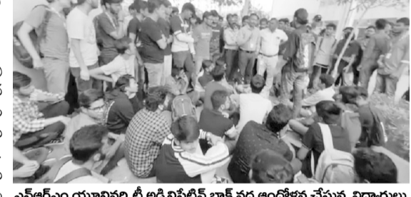
ఎస్ఆర్ఎం యూనివర్సిటీ అడ్మినిస్ట్రేటివ్ బ్లాక్ వద్ద ఆందోళన చేస్తున్న విద్యార్థులు

విద్యార్థుల ఆందోళన ప్రజాశక్తి - మంగళగిరి రూరల్ (గుంటూరు జిల్లా) మెన్, హాస్టల్ ఫీజుల పెంపు నిరసనపై రాజధాని ప్రాంతమైన నీరుకొండలోని ఎస్ఆర్ఎం యూనివర్సిటీ విద్యార్థులు గురువారం ఆందోళనకు దిగారు. మెన్, హాస్టల్ ఫీజులు రూ.10 వేలు పెంచడంతో ఆగ్రహం వ్యక్తం చేశారు. సుమారు 300 మంది వరకు విద్యార్థులు వర్సిటీ అడ్మినిస్ట్రేటివ్ బ్లాక్ వద్దకు చేరుకుని అక్కడే ఖైరాంతున్నారు. వర్సిటీ యాజమాన్యానికి వ్యతిరేకంగా నిరాదాలు చేశారు. తమకు కొత్తగా సౌకర్యాల్లోకి తర్ఫించుకుంటే ఇంత ఫీజు ఎందుకు పెంచారని ప్రశ్నించారు. ఇప్పటికే అధికంగా ఫీజులు తీసుకుంటున్నా సరైన చర్యలు తీసుకుంటామని హామీ ఇవ్వడంతో ఆందోళన విరమించారు.