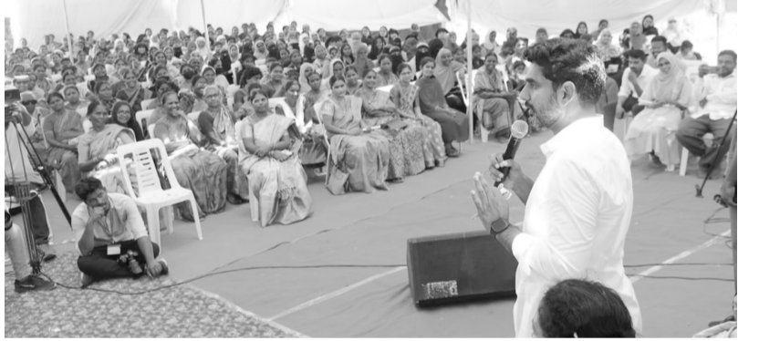
కర్నూలు జిల్లా బస్సిపాడు సమీపంలో ఏర్పాటు చేసిన మహిళలతో ముఖాముఖి మాట్లాడుతున్న నారాలోకేష్

ప్రజాశక్తి-కర్నూలు ప్రతినిధి టిడిపి అధికారంలోకి రాగానే మహిళల స్వయం ఉపాధికి కార్యచరణ రూపొందిస్తామని ఆ పార్టీ జాతీయ ప్రధాన కార్యదర్శి నారా లోకేష్ పేర్కొన్నారు ఆయన చేపట్టిన యువగళన పాదయాత్ర గురువారం పాణ్యం నియోజకవర్గం కల్లూరు మండలంలో సాగింది. రేమడూరు విడిది కేంద్రం నుంచి ప్రారంభమైన పాదయాత్ర పునులూరు, బొబ్బలవరం, బస్సిపాడు, చినకొట్లాల మీదగా పెడకొట్లాలకు చేరుకుంది. వాటికి బోయలు, ఎన్సీలు, ఆయా గ్రామాల ప్రజలు యువనేతను కలిసి తమ సమస్యలు చెప్పుకున్నారు. బొబ్బలవరం శివార్లలో మహిళలతో లోకేష్ ముఖాముఖి నిర్వహించారు. ఈ సందర్భంగా ఆయన మాట్లాడుతూ టిడిపి అధికారంలోకి వచ్చాక మహిళా రక్షణకు చట్టాలు మార్చడమే కాదని, మహిళల్ని గౌరవించడం చిన్నపట్టి నుండే నేర్పిస్తామని తెలిపారు. మహిళల గొప్పతనం, వారి కష్టం అందరికీ తెలిసేలా కేజీ నుండి పీజీ వరకూ ప్రత్యేక పాఠ్యాంశాలు తీసుకొస్తామన్నారు. దశ చట్టం ప్రతిపాదించారని, అసలు చట్టమే లేకుండా స్టేషనరీ ప్రార్థనలను అన్నారు. టిడిపి అధికారంలోకి వచ్చిన వెంటనే పెట్రోల్, డీజిల్ లపై పన్ను తగ్గించి ధరలు తగ్గేలా చేస్తామని, నిత్యావసర సరకుల ధరలు, పన్నుల భారం తగ్గిస్తామని హామీ ఇచ్చారు. ఆర్ధి రంగాల్లో మహిళల్ని ప్రోత్సహించే విధంగా చేస్తామని, సబ్సిడీ రుణాలు అందజేసి మహిళా పారిశ్రామిక వేళ్లకుగా మారేందుకు సహకారాన్ని తెలిపారు. మహిళలకు ఇచ్చిన హామీల్ని అమలు