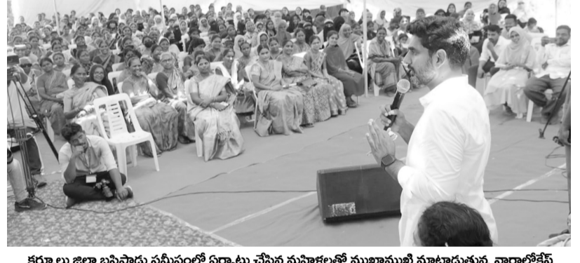
కర్నూలు జిల్లా బస్తిపాడు సమీపంలో ఏర్పాటు చేసిన మహిళలతో ముఖాముఖి మాట్లాడుతున్న నారాలోకేష్

ప్రజాశక్తి-కర్నూలు ప్రతినిధి టిడిపి అధికారంలోకి రాగానే మహిళల స్వయం ఉపాధికి కార్యచరణ రూపొందిస్తామని ఆ పార్టీ జాతీయ ప్రధాన కార్యదర్శి నారా లోకేష్ పేర్కొన్నారు. ఆయన చేపట్టిన యువశక్రం పాదయాత్ర గురువారం పాల్వూరు నియోజకవర్గం కల్వూరు మండలంలో సాగింది. రేమడూరు ఏడిడి కేంద్రం నుంచి ప్రారంభమైన పాదయాత్ర పునులూరు, బొల్లవరం, బస్తిపాడు, చినకొట్లాల మీదుగా పెదకోట్లాలకు చేరుకుంది. పార్టీకి బోయలు, ఎస్సీలు, అయి గ్రామాల ప్రజలు యువనేతను కలిసి తమ సమస్యలు చెప్పుకున్నారు. బొల్లవరం శివార్లలో మహిళలతో లోకేష్ ముఖాముఖి నిర్వహించారు. ఈ సందర్భంగా ఆయన మాట్లాడుతూ టిడిపి అధికారంలోకి వచ్చాక మహిళల రక్షణకు చట్టాలు మాత్రమే కాదని, మహిళల్ని గౌరవించడం చిన్నప్పటి నుండే నేర్పిస్తామని తెలిపారు. మహిళల గొప్పతనం, పారి కష్టం అందరికీ తెలిసేలా కేజీ నుండి పీజీ వరకూ ప్రత్యేక పాఠ్యాంశాలు తీసుకొస్తామన్నారు. దిశ చట్టం పెద్ద మోసంవని, అసలు చట్టమే లేకుండా స్వేచ్ఛా ప్రారంభించారని అన్నారు. టిడిపి అధికారంలోకి వచ్చిన వెంటనే పెట్రోల్, డీజిల్ పై పన్ను తగ్గించి ధరలు తగ్గేలా చేస్తామని, నిత్యావసర సరుకుల ధరలు, పన్నుల భారం తగ్గించామని హామీ ఇచ్చారు. అన్ని రంగాల్లో మహిళల్ని ప్రోత్సహించే విధంగా చేస్తామని, సబ్సిడీ రుణాలు అందజేసే మహిళా పారిశ్రామిక వేత్తలుగా మారేందుకు సహకారాన్ని తెలిపారు. మహిళలకు ఇచ్చిన హామీల్ని అమలు