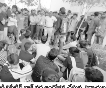
ఎన్ఆర్ఎం యూనివర్సిటీ అడ్మినిస్ట్రేషన్ బ్లాక్ వద్ద ఆందోళన చేస్తున్న విద్యార్థులు

విద్యార్థుల ఆందోళన ప్రజాశక్తి - మంగళగిరి రూరల్ (గుంటూరు జిల్లా) మెన్, హాస్టల్ ఫీజుల పెంపు నిరసనల్ని రాజధాని ప్రాంతమైన నీరుకొండలోని ఎన్ఆర్ఎం యూనివర్సిటీ విద్యార్థులు గురువారం ఆందోళనకు దిగారు. మెన్, హాస్టల్ ఫీజులు రూ.10 వేలు పెంచడంతో అగ్రహం వ్యక్తం చేశారు. సుమారు 300 మంది పరకు విద్యార్థులు వర్సిటీ అడ్మినిస్ట్రేషన్ బ్లాక్ వద్దకు చేరుకుని అక్కడే బైకూరుంచారు. వర్సిటీ యాజమాన్యానికి వ్యతిరేకంగా నివాదాలు చేశారు. తమకు కేంద్రంగా సౌకర్యాలేమీ కల్పించకుండానే ఇంక ఫీజు ఎందుకు పెంచారని ప్రశ్నించారు. ఇప్పటికే అధికంగా ఫీజులు తీసుకుంటున్నా సరైన సదుపాయాల కల్పించడం లేదని ఆవేదన వివరించారు. ఇదే వర్సిటీలో రెండు రోజుల కిందట