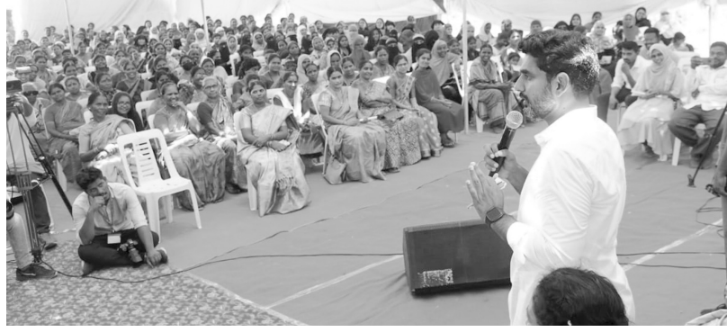
కర్నూలు జిల్లా బస్తిపాడు సమీపంలో ఏర్పాటు చేసిన మహిళలలో ముఖాముఖి మాట్లాడుతున్న నారాలోకేష్

ప్రజాశక్తి-కర్నూలు ప్రతినిధి టిడిపి అధికారంలోకి రాగానే మహిళల స్వయం ఉపాధికి కార్యచరణ రూపొందిస్తామని ఆ పార్టీ జాతీయ ప్రధాన కార్యదర్శి నారా లోకేష్ పేర్కొన్నారు ఆయన చేపట్టిన యువగళం పాదయాత్ర గురువారం పాణ్యం నియోజకవర్గం కల్వార మండలంలో సాగింది. రేమడూరు విడిది కేంద్రం నుంచి ప్రారంభమైన పాదయాత్ర పునులూరు, బొల్లవరం, బస్తిపాడు, వినకొట్లాల మీదగా పెడకొట్లాలకు చేరుకుంది. వాటికి బోయలు, ఎస్సీలు, ఆయా గ్రామాల ప్రజలు యువనేతను కలిసి తమ సమస్యలు చెప్పుకున్నారు. బొల్లవరం శివార్లలో మహిళలతో లోకేష్ ముఖాముఖి నిర్వహించారు. ఈ సందర్భంగా ఆయన మాట్లాడుతూ టిడిపి అధికారంలోకి వచ్చాక మహిళల రక్షణకు చట్టాలు అమలుచేస్తామని, మహిళల్ని గౌరవించడం చిన్నప్పటి నుండే నేర్పాటుమని తెలిపారు. మహిళల గొప్పతనం, వారి కష్టం అందరికీ తెలిసేలా కేజ్రీ నుండి షీబ్ వరకూ ప్రత్యేక పాఠశాలలు తీసుకొస్తామన్నారు. దీక్ష వట్టు పెద్ద మోసమని, అసలు చట్టమే లేకుండా స్వేచ్ఛ ప్రారంభించారని అన్నారు. టిడిపి అధికారంలోకి వచ్చిన వెంటనే పెట్రోల్, డీజిల్ పై పన్ను తగ్గించి ధర్లు తగ్గిలా చేస్తామని, నిత్యావసరం సరకుల ధరలు, పన్నుల భారం తగ్గిస్తామని హామీ ఇచ్చారు. అన్ని రంగాల్లో మహిళల్ని ప్రోత్సహించే విధంగా చేస్తామని, పిల్లల్ని రక్షించాలి అందరికీ మహిళా పాఠశాలను వేళ్లకొని మారేందుకు సహకరిస్తామని తెలిపారు. మహిళలకు ఇచ్చిన హామీలన్ని అమలు