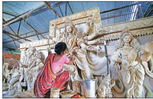
An artisan works on a clay model of Goddess Durga ahead of the 'Durga Puja' festival, in Agartala on Tuesday.

It said the High Court rejected their prayer that monitoring of investigation by the court be continued till the probe by ATS was taken to a logical end. The plea said from the material placed on record by SIT along with chargesheets, it was evident that there existed a "deeper and larger conspiracy" and Pansare's murder was not a lone incident.