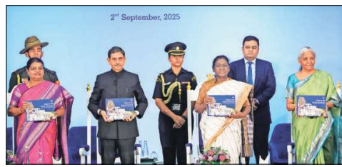
President Droupadi Murmu, Finance Minister Nirmala Sitharaman, Tamil Nadu Governor R.N. Ravi and State Minister Geetha Jeevan during the 120th foundation day celebrations of City Union Bank, in Chennai on Tuesday.