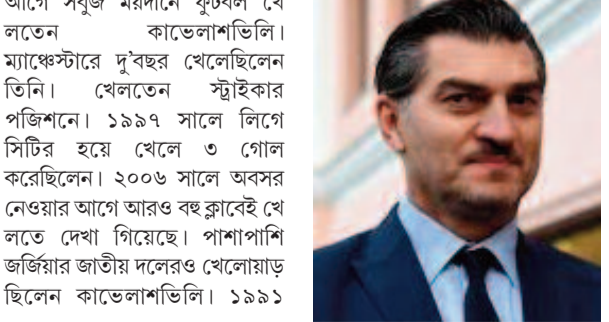
সাল থেকে ২০০২ সাল পর্যন্ত ৪৬টি ম্যাচ খেলে গোল করেছেন ৯টি। প্রসঙ্গত, তাঁকে প্রেসিডেন্ট হিসেবে নির্বাচিত করার বিষয়টি দেশের বহু মানুষের অপছন্দ। জর্জিয়ার চারটি প্রধান দলই এই সিদ্ধান্তের বিরোধিতা করে অভিযোগ করেন, গত অক্টোবরে হওয়া নির্বাচনে ব্যাপক কারচুপি হয়েছিল। তবে তাঁর দলের বিরুদ্ধে জনরোষ গড়ে ওঠার প্রধান কারণ

ভিবিএলি, ১৪ ডিসেম্বর: জর্জিয়ার পরবর্তী প্রেসিডেন্ট হচ্ছেন ম্যাথ্বেস্টার সিটির প্রাক্তন ফুটবলার মিখাইল কাভেলাশভিলি। ৫৩ বছরের ওই ব্যক্তি জর্জিয়ার ড্রিম পার্টার প্রাক্তন সাংবাদিক। তিনিই ছিলেন প্রেসিডেন্ট পদের একমাত্র প্রার্থী। তাঁর মনোনয়নের ব্যাপারে সিলমোহর দেয় তাঁর দল পরিচালিত ইনস্ট্রোয়াল কলেজ।