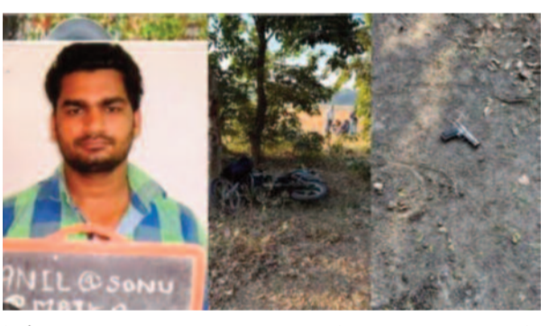
উঠেছিল সে। তার বিরুদ্ধে লুটপাট, ডাকাতি, তোলাবাজি, খুনের চেষ্টা-সহ হাজারও অভিযোগ ছিল। একদিকে এই দুষ্কৃতীকে যেমন খ

লখনউ, ১৪ ডিসেম্বর: ফের এনকাউন্টার যোগীরাজ্যে। শনিবার পুলিশের সঙ্গে গুলির লড়াইয়ে গুরুতর আহত হয় এক দুষ্কৃতী। চিকিৎসা চলাকালীন মৃত্যু হয় তার। মৃত ব্যক্তির বিরুদ্ধে দিল্লি ও উত্তরপ্রদেশে একাধিক খুনের মামলা ছিল বলে জানিয়েছে পুলিশ। ঘটনার তদন্ত শুরু হয়েছে।