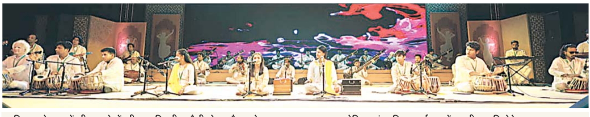
हरियाणा के नूह में जी-20 देशों की चार दिवसीय चौथी शेरपा बैठक के समापन अवसर पर आयोजित सांस्कृतिक कार्यक्रम में अपनी प्रस्तुति देते कलाकार।

से रूबरू होने का मौका मिला। चौथी शेरपा बैठक में हर रोज सांस्कृतिक कार्यक्रमों के माध्यम से विदेशी डेलीगेट्स के समक्ष भारत की अनेकों में एकता की तस्वीर प्रस्तुत