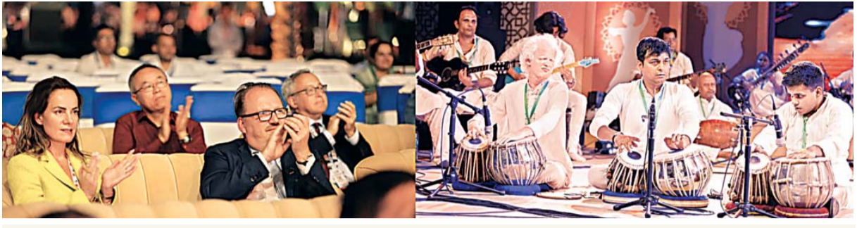
हरियाणा के नूह में जी-20 देशों की चार दिवसीय चौथी शेरपा बैठक के समापन अवसर पर आयोजित सांस्कृतिक कार्यक्रम में भारतीय शास्त्रीय संगीत का आनंद लेते हुए विदेशी मेहमान।

बैठक में औपचारिक बैठकों के अलावा सभी देशों के शेरपाओं ने कूटनीतिक, आपसी सहयोग, समझ और विश्वास को बढ़ावा देने के साथ साथ व्यक्तिगत संबंधों को प्रगाढ़ किया। बैठक में भाग लेने पहुंचे विदेशी डेलीगेट्स को हरियाणा की समृद्ध परंपरा व संस्कृति