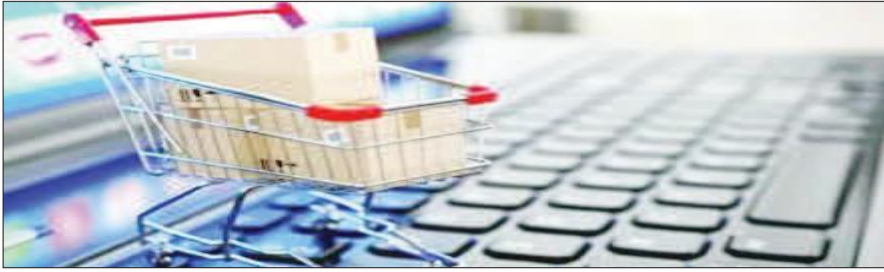
आयोजित ग्रेट इंडिया रिटेल समिट 2025 में जारी की। अनारॉक के अनुसार, भारतीय ई-कॉमर्स बाजार

डॉलर तक पहुंचने का अनुमान है। यह जानकारी अनारॉक और ईटी रिटेल की संयुक्त रिपोर्ट में दी गई है। रिपोर्ट के मुताबिक, 2024 में भारत का ई-कॉमर्स बाजार 125 अरब डॉलर का था।