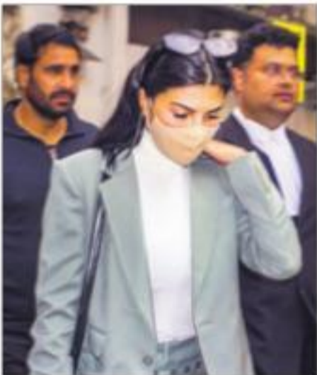
ਨਵੀਂ ਦਿੱਲੀ ਵਿੱਚ ਪੇਸ਼ ਮਗਰੋਂ ਅਦਾਕਾਰਾ ਜੈਕੁਲਿਨ ਫਰਨਾਂਡੇਜ਼।