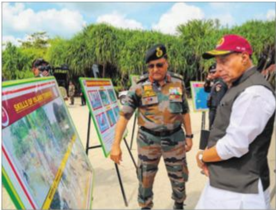
ਪੱਟਰ ਬਲੇਅਰ ਵਿੱਚ ਹਵਾਈ ਸਟੇਸ਼ਨ ਆਈਐੱਨਐੱਸ ਬਾਜ਼ ਦਾ ਦੌਰਾ ਕਰਦੇ ਹੋਏ ਕੇਂਦਰੀ ਰੱਖਿਆ ਮੰਤਰੀ ਰਾਜਨਾਥ ਸਿੰਘ।

ਪੱਟਰ ਬਲੇਅਰ, 6 ਜਨਵਰੀ ਰੱਖਿਆ ਮੰਤਰੀ ਰਾਜਨਾਥ ਸਿੰਘ ਨੇ ਅੱਜ ਭਾਰਤੀ ਜਲ ਸੈਨਾ ਦੇ ਹਵਾਈ ਸਟੇਸ਼ਨ ਆਈਐੱਨਐੱਸ ਬਾਜ਼ ਦਾ ਦੌਰਾ ਕੀਤਾ। ਇਹ ਸਟੇਸ਼ਨ ਗੁੱਟ ਨਿਕੋਬਾਰ ਟਾਪੂ 'ਤੇ ਕੈਂਪਬੈੱਲ ਖਾੜੀ ਵਿੱਚ ਹੈ, ਜਿੱਥੇ ਇਹ ਭਾਰਤੀ ਹਥਿਆਰਬੰਦ ਬਲਾਂ ਦੀ ਅੰਡੇਮਾਨ ਤੇ ਨਿਕੋਬਾਰ ਕਮਾਂਡ ਸਾਂਝੀਆਂ ਸੇਵਾਵਾਂ ਅਧੀਨ ਹੈ।