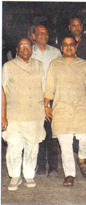
Chief Minister Nayab Singh Saurya with other officials at the Haryana Vidhan Sabha in Chandigarh.