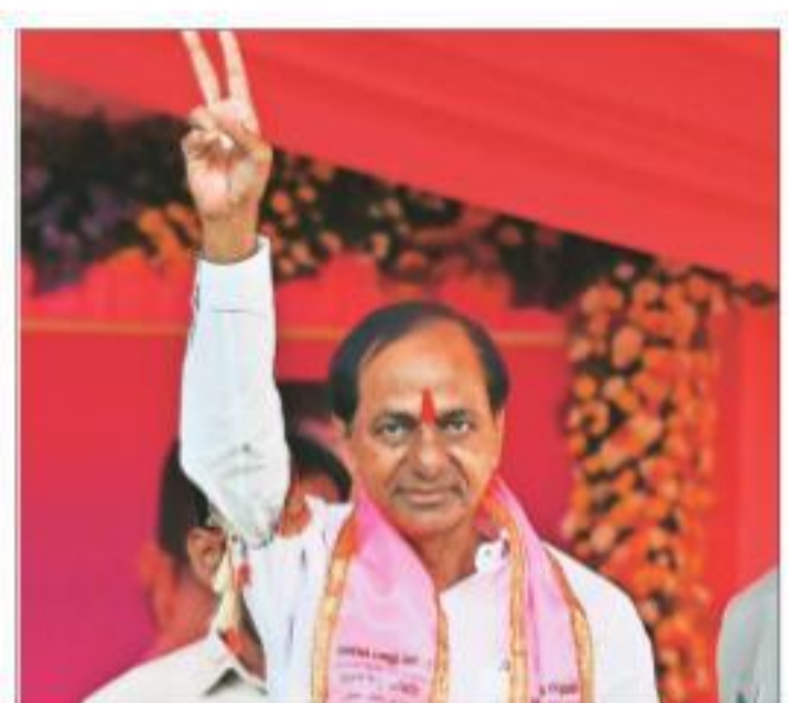
Sitting MLA from Gajwel, CM also in race from Kamareddy