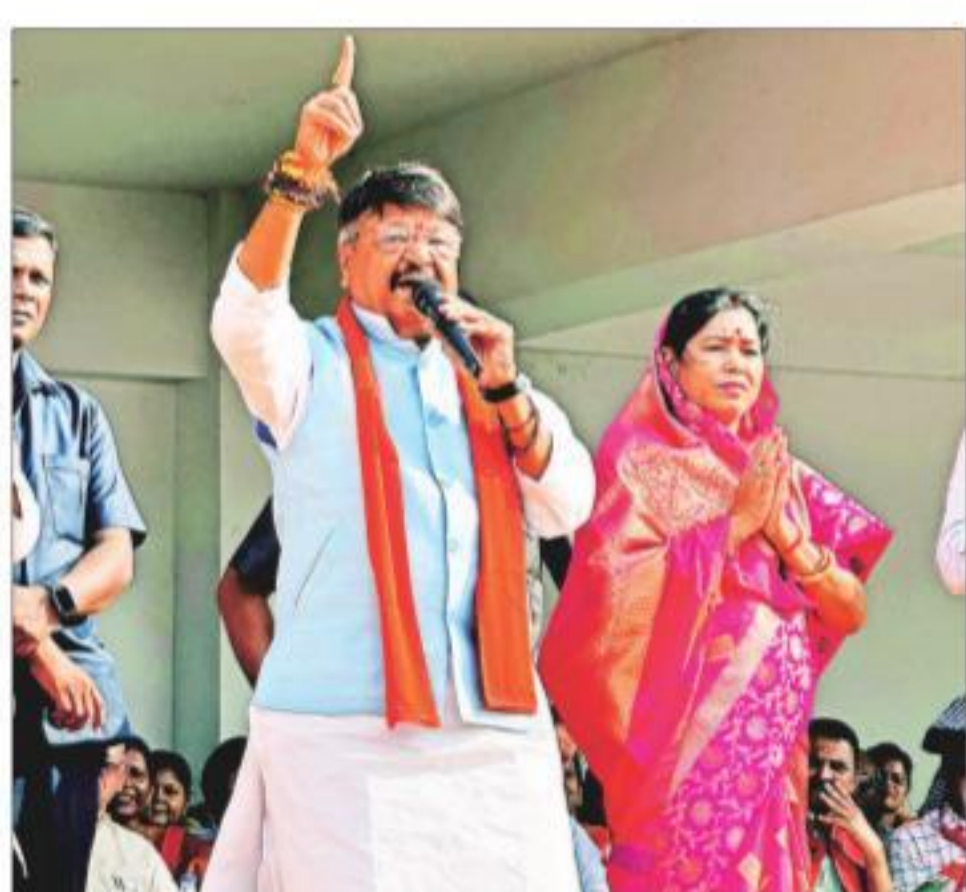
Vijayvargiya hints his political ambitions remain. 'Party will give other responsibilities.'

Whoever holds sway in the region's 66 seats generally goes on to form the government. In 2013, the BJP had won 57 seats in the region. But in 2018, when the Congress won with a thin majority, 36 of the 66 seats went to the party. The BJP won 28. While Vijayvargiya clearly