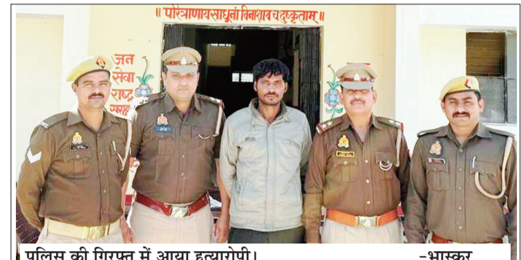
पुलिस की गिरफ्त में आया हत्यारोपी।

ललितपुर। थाना नाराहट के ग्राम बछरई में दिल्ली से घर लौटते मजदूरी की गलाघोट कर हत्या करने के मामले में पुलिस हत्यारोपी की तलाश में आस-पास के जंगल व मध्यप्रदेश सहित अन्य कई स्थानों पर हत्यारोपी की तलाश कर रही थी। लेकिन पुलिस के हाथ सफलता नहीं लग पा रही थी। बीते सोमवार की रात थाना नाराहट क्षेत्र के जंगल में चलाये गये सर्च अभियान के दौरान पुलिस को सफलता हाथ लग गयी। पुलिस गिरफ्त में आये हत्यारोपी ने मृतक से उधार लिये बीस हजार रुपये के तगादे व पत्नी के खिलाफ आपत्तिजनक बातों से परेशान होकर शराब के नशे में हत्या करने का पुलिस ने खुलासा किया है। पुलिस ने हत्यारोपी को गिरफ्तार कर जेल भेजने की प्रक्रिया शुरू कर दी है।