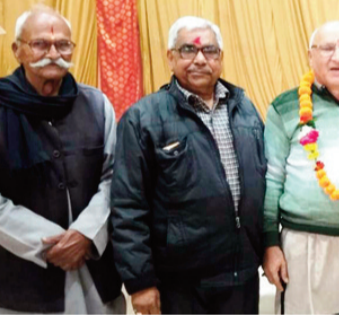
बैठक के दौरान मौजूद पदाधिकारी।

ललितपुर। उत्तर प्रदेशीय सेवा निवृत्त शिक्षक कल्याण परिषद की एक आवश्यक बैठक श्रीनृसिंह