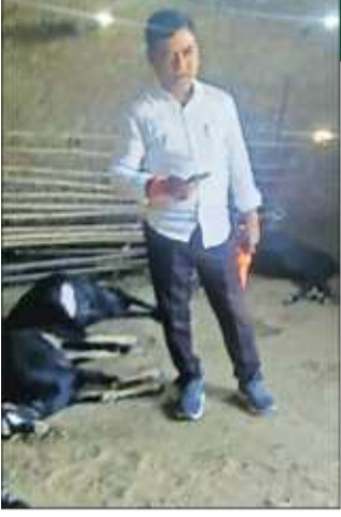
An official taking stock of the dead goats in the cowshed.

to light in the Parsodi area of Paoni taluka, triggering fear among farmers and livestock owners.