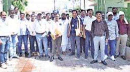
Officials present for the door-to-door trial.

Census 2027 will be conducted entirely in digital mode and implemented in two phases. The first phase, 'House Listing and Housing Census,' is scheduled from May 16 to June 14, 2026. During this period, enumerators will visit households and collect data based on a structured questionnaire of 34 questions, interacting with