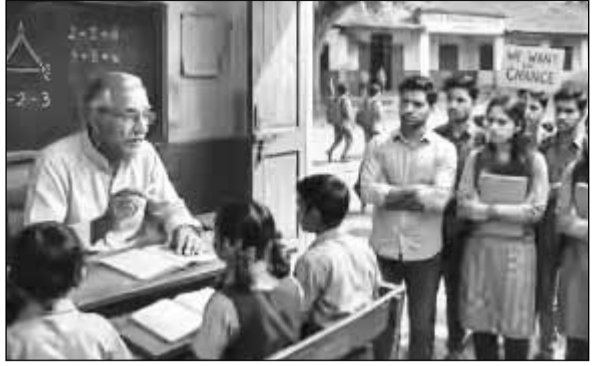
मानसिकदृष्ट्या खचून जातात. लक्ष्य पूर्ण करणे आणि शासनाच्या योजनांचे अंमलबजावणी साधण्यासाठी शिक्षकांचे पूर्ण लक्ष असणे आवश्यक असते. मात्र, शिक्षक 'डेटा' भरण्यात व्यस्त राहिल्यामुळे विद्यार्थ्यांचे वाचन, लेखन आणि गणिती कौशल्ये खालावत आहे.

असून परिस्थिती नियंत्रणात आहे. सदर घटनेचे सुरक्षा विभागातर्फे 'सेफ्टी ऑडिट' सुरू करण्यात आले असून प्रथमदर्शनी सुरक्षा नियमांचे कोणतेही उल्लंघन झालेले दिसून येत नसल्याची माहिती महानिर्मितीने प्रसिद्धिपत्रकाद्वारे दिली आहे. महानिर्मितीकडून उपचाराचा खर्च महाराष्ट्र राज्य वीज निमिती कंपनी (महानिर्मिती) तर्फे सर्व जखमींना सर्वोत्तम वैद्यकीय उपचार उपलब्ध करून देण्यात येत असून अपघातग्रस्त कर्मचाऱ्यांचा वैद्यकीय उपचारांचा सर्व खर्च महानिर्मितीतर्फे करण्यात येणार आहे. तसेच जखमींची योग्य ती काळजी घेण्यात येत असल्याची माहिती देण्यात आली आहे. ◆ (तथा वृत्तसेवा)