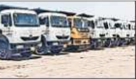
A tipper truck.

After this, the tehsil administration and police called the Buldhana Regional Transport Office. When the RTO team checked the weight of the vehicles on the electronic scale, it became clear that many tippers were overloaded.