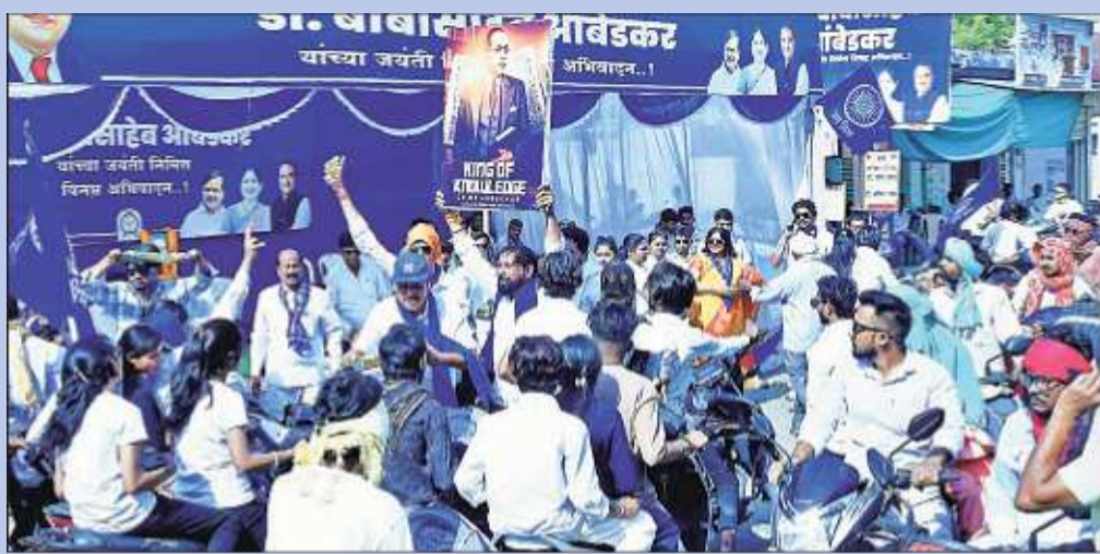
Rally being taken out in Gondia.