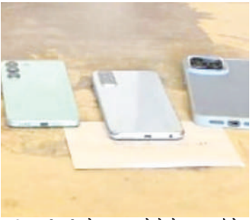
अधिकारी की प्रोफाइल फोटो के साथ मैसेज आए, जिससे फरियादी डर गण्णा।