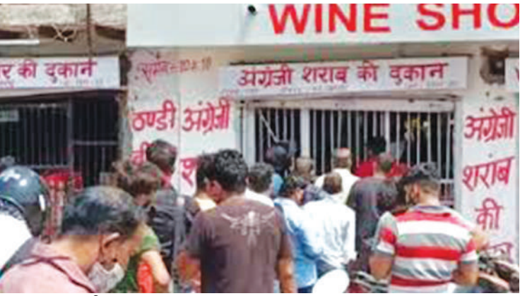
स्वदेश ज्योति संवाददाता, जबलपुर