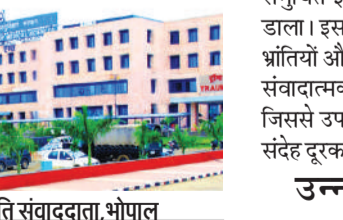
स्वदेश ज्योति संवाददाता, भोपाल