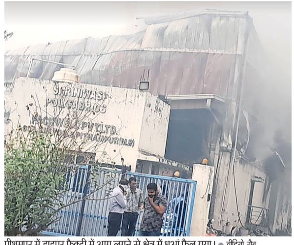
पीथमपुर में डाइपर फैक्ट्री में आग लगने से क्षेत्र में धुआं फैल गया।

नईदुनिया न्यूज, पीथमपुर: औद्योगिक क्षेत्र पीथमपुर में बुधवार सुबह एक डाइपर फैक्ट्री में अचानक भीषण आग लग गई। आग पर काबू पाने के लिए धार, इंदौर, महू, देपालपुर सहित कई स्थानों से दमकलें मौके पर पहुंचीं। रात को जाकर आग पर काबू पाया जा सका।