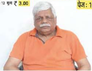
सांसद ने लोकसभा में की उतरी कोयल...