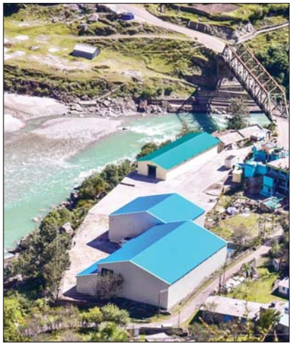
उत्तरकाशी का झाला गांव। फाइल फोटो।

उत्तरकाशी (एसएनबी)। जिले का झाला गांव स्वच्छता की खास पहल में दूसरों के लिए प्रेरणा बना है। यहां के युवाओं ने धन्यवाद प्रकृति अभियान के तहत गांव को स्वच्छता में नई दिशा प्रदान की है। जहां गांव के युवा हर दिन दो घंटे गांव में स्वच्छता अभियान चला रहे हैं। प्रधानमंत्री नरेंद्र मोदी ने भी रविवार को मन की बात कार्यक्रम में झाला गांव के युवाओं की पहल की सराहना करते हुए कहा कि ऐसी पहल देश में परिवर्तन ला सकती है। पीएम की सराहना पर गांव और क्षेत्र में खुशी का माहौल है।