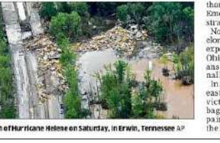
Flood damage in the aftermath of Hurricane Helene on Saturday, in Erwin, Tennessee AP

Rescuers struggled with washed out bridges and debris-strewn roads Saturday in the search for survivors of devastating Storm Helene, which killed at least 63 people across five states and caused massive power outages. Helene slammed into Florida Thursday as a Category 4 hurricane and surged north, gradually weakening but leaving in its wake fallen trees, downed power lines and mangled wrecked homes. Federal emergency workers were dispatched to Alabama, Florida, Georgia, North Carolina, South Carolina and Tennessee—with more than 800 personnel from the Federal Emergency Management Administration (FEMA) deployed. Now classified as a "post-tropical cyclone", the remnants of the storm are expected to continue inundating the Ohio Valley and central Appalachians through Sunday, said the National Hurricane Center. In affected communities across the eastern coast and midwest, storm victims and volunteers tried to clear brush, mops and hammers tried to repair what they could and clean up the mess. AFP