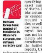
Russian forces took control of Makivka in Ukraine's Luhansk, the defence ministry said.

Moscow: Russia's defence ministry said on Sunday that its forces had repelled six new Ukrainian attempts to enter its western Kursk region along the border since Wednesday. The defence ministry said it had taken control of the settlement of Makivka in eastern Ukraine's Luhansk region. The ministry said in a post on the Telegram messaging app that its forces, with the support of aircraft and artillery rounds, repelled attempts to enter the village of Novy Put, some 79 kilometres (50 miles) west of Sudzha, a strategic crossing point for Russian natural gas exports to Europe via Ukraine. Ukraine on August 6 launched the biggest foreign attack on Russia since World War II, bursting through the border into the Kursk region, supported by swarms of drones and heavy weaponry. In July, Ukraine's President Zelenskyy said that his forces controlled the area of operations in the Kursk region over an area of over 1,300 sq