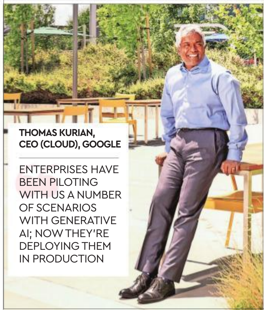
THOMAS KURIAN, CEO (CLOUD), GOOGLE Thomas Kurian, chief executive officer of Google Cloud, at the company's campus

Google, a unit of Alphabet, trails Amazon.com and Microsoft in cloud computing, but the market is one of the tech giant's best bets for growth as its core search advertising business matures. Google reported the first full year of profitability at its cloud unit in 2023 and hopes to use its prowess in AI to close the gap with rivals. After OpenAI's ChatGPT burst onto the scene in late 2022 and was quickly embraced by college students and the general pub-