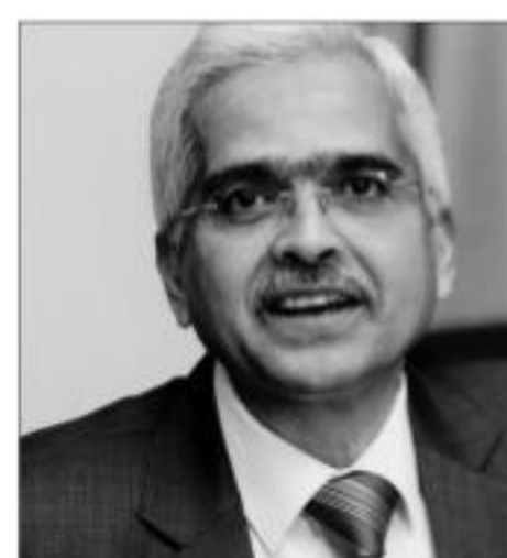
Shaktikanta Das, RBI governor

The one-day event is designed to be an interactive one where directors, including the bank chairman, and nominee directors both from the central bank and the government, will be invited to interact with the entire RBI top brass.