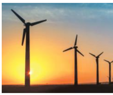
India looks to achieve 500 Gw of renewable energy capacity by 2030

The notice has been sent to Solar Energy Corporation of India (SECI), a statutory body under MNRE, responsible for tendering renewable energy projects,