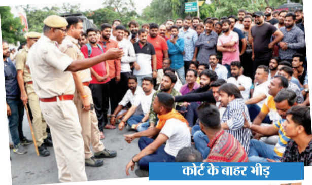
कोर्ट के बाहर भीड़