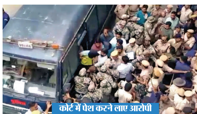
कोर्ट में पेश करने लिए आरोपी