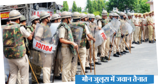
गौन जुलूस में जवान तेनात