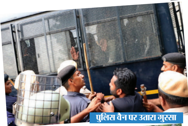
पुलिस वैन पर उतारा गुस्सा