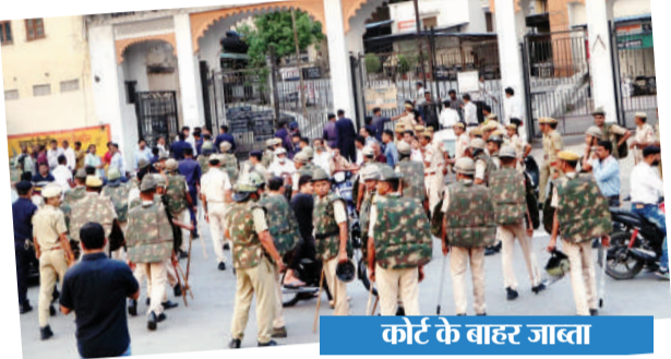
कोर्ट के बाहर जाब्ता