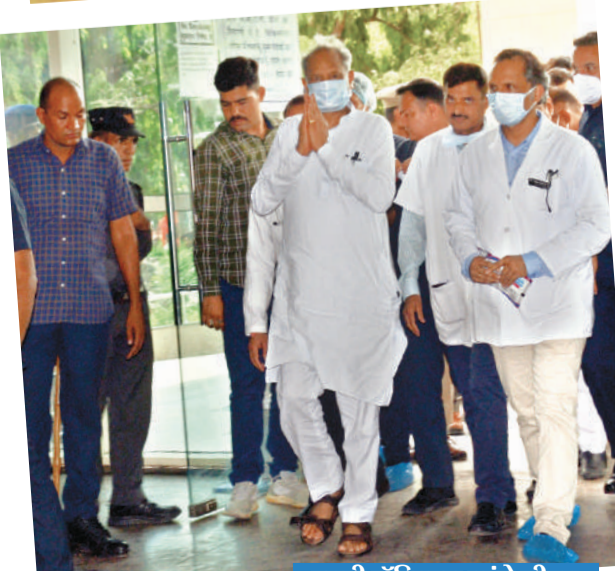
एमबी हॉस्पिटल पहुंचे सीएम