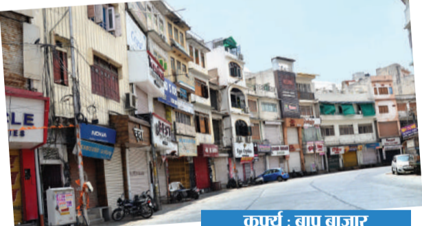
कपर्सू : बापू बाजार