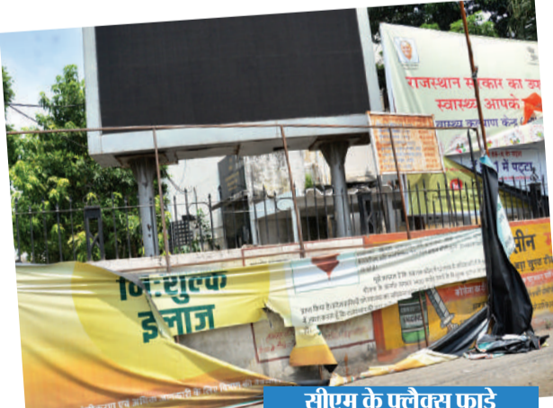
सीएम के फ्लेक्स फाड़े