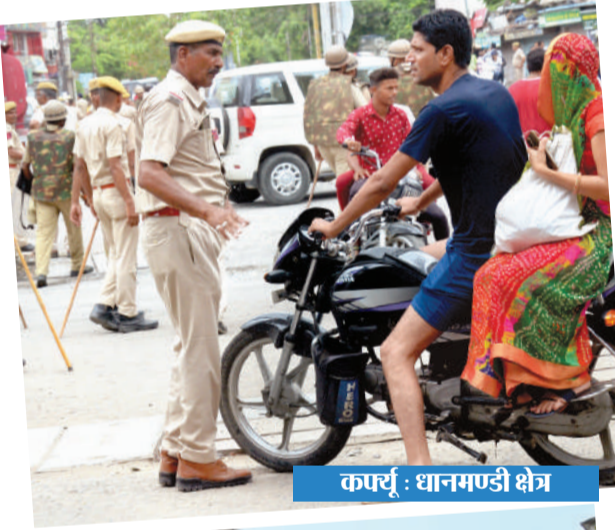
कपर्सू : धानमण्डी क्षेत्र