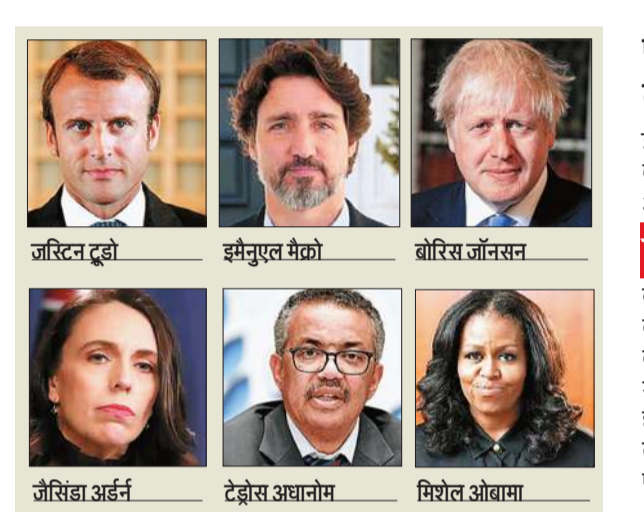
जस्टिन ट्रूडो, एमैनुएल मैक्रो, बोरिस जॉनसन, जैसिंडा अर्डर्न, टेड्रोस अघानोम, मिशेल ओबामा

अमेरिका में गर्भपात के लिए संवैधानिक सुरक्षा को खत्म करने को विश्व नेताओं और स्वास्थ्य संगठनों ने पिछड़ा कदम करार दिया है। कनाडा के प्रधान मंत्री जस्टिन ट्रूडो, फ्रांस के राष्ट्रपति एमैनुएल मैक्रो और ब्रिटेन प्रधानमंत्री बोरिस जॉनसन ने रो बना वेड फैसले को उलटने की निंदा की है। न्यूजीलैंड की पीएम जैसिंडा अर्डर्न ने कहा यह बहुत ही निराशाजनक है। एक महिला के अपने शरीर पर निर्णय लेने के मौलिक अधिकार को हटाना परेशान करने वाला है। राष्ट्रपति जो बाइडेन ने भी शीर्ष अदालत के इस फैसले को एक दुःखद गलती बताया है। विश्व स्वास्थ्य संगठन के प्रमुख टेड्रोस अघानोम ने कहा कि वह फैसले से चिंतित और निराशा हैं। पूर्व प्रथम महिला मिशेल ओबामा ने कहा, मैं देशभर के उन लोगों के लिए काफी दुःखी हूँ जिन्होंने अपने शरीर को लेकर लिए जाने वाले सूचित निर्णय के अधिकार को खो दिया।