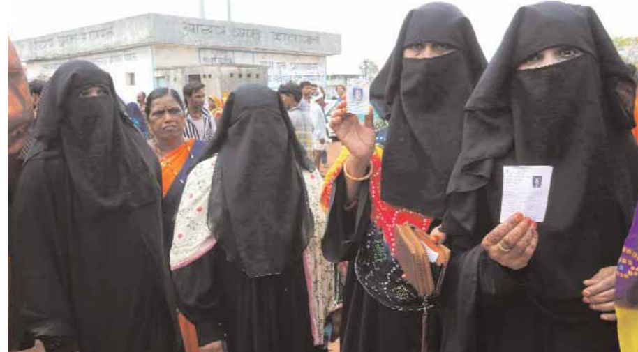
Muslim voters wait for their turn cast their votes at a polling station for the first phase of Madhya Pradesh Panchayat elections, Gram Panchayat Kala Pani, in Bhopal on Saturday.

Six small packets containing some unknown powder, apparently the drug, was also recovered from his possession, she said. "The accused was arrested and was taken on one-day police remand to find out the source of the poisonous powder. Interrogation is ongoing," said Roy.