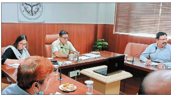
पीपुल्स ब्यूरो • लखनऊ editor@peoplessamachar.co.in