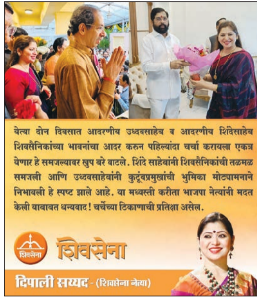
येत्या दोन दिवसांत आदरणीय उद्धवसाहेब व आदरणीय शिंदेसाहेब शिवसैनिकांच्या भावनांचा आदर करून पहिल्यांदा चर्चा करायला एकत्र येणार हे सभ्यत्वानेच खूप बरे वाटेल. शिंदे साहेबांनी शिवसैनिकांची तळमळ समजली आणि उद्धवसाहेबांनी कुटुंबप्रमुखाची भूमिका मोठ्यामनाने निभावली हे स्पष्ट झाले आहे. या मध्यस्थी करिता भाजपा नेत्यांनी मदत केली याबाबत धन्यवाद! चर्चेच्या ठिकाणाची प्रतीक्षा असेल.