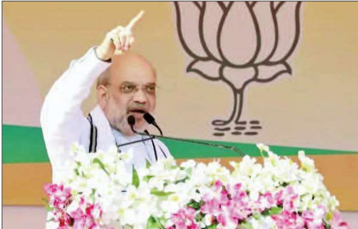
শাহ আপকে লক্ষ্য করে প্রধানমন্ত্রী নরেন্দ্র মোদিকে প্রায়ই বলতে শোনা যায়, 'রেগুড়ি কালাকার' বিধায়ীরা নাকি কিছু টাকা, বিবৃতি ছি, যুক্তকণের টাকা দেওয়ার, বুদ্ধদের পেনশন দেওয়ার প্রতিশ্রুতি দিয়ে নির্বাচন জেতার চেষ্টা করে। এদিকে উত্তরপ্রদেশেও তা একই কাণ্ড ঘটিয়েছে বিজেপি। এরপরই গুজরাতের নির্বাচন জিততে কল্পের প্রধানমন্ত্রী মোদী স্বয়ং। মুখ্যমন্ত্রীর মতো বদমায়েনদের থেকেও আরও এক ধাপ এগিয়ে এদের পর এক ঘোষণা হয়েছে। পশ্চিমবঙ্গে 'সবুজ সাথী' প্রকল্পে সাইকেল দেওয়া হয়েছে। আর এখানে দেওয়া হচ্ছে স্কুটি। যে 'দুয়ারে রেশন' নিয়ে বাংলা তোলপাড়, গুজরাতের বিজেপি ক্ষমতায় থাকলে এই 'দুয়ারে রেশন'-এরই প্রতিশ্রুতি দিয়েছেন তারা।

কেন্দ্রীয় স্বরাষ্ট্রমন্ত্রী অমিত শাহের চোখে, 'আপ শুরু করেছিলেন ভালই, কিন্তু হঠাৎ তাদের জোশ খতম। অমিত শাহ নিজেরই বলেছেন, 'ওসব আপ টাপ কেউ নেই, সামনে আছে কংগ্রেস, তাকে হারাতে হবে।' অমিত শাহ স্বয়ং হঠাৎ-ই আপকে একেবারে বিধানসভা নির্বাচনে অপ্রাসঙ্গিক হিসেবে চিহ্নিত করতে গুজরাত বিধানসভা নির্বাচন নিয়ে প্রশ্ন তুলে দিলেন। তারপরই কংগ্রেস, পাশাপাশি মনে করিয়ে দিয়েছেন ২০০২-এর কথা, গুজরতের এমএন শিখা দেওয়াল হয়েছে যে, 'ওরা ঘরে ঢুকে গিয়েছে, অত্যাচার অনাচার করার কথা ভাবতেও পারছে না।' এই 'ওদেরকে' বলতে অমিত শাহ কাদেরকে বোঝাচ্ছেন তা কিন্তু স্পষ্ট।